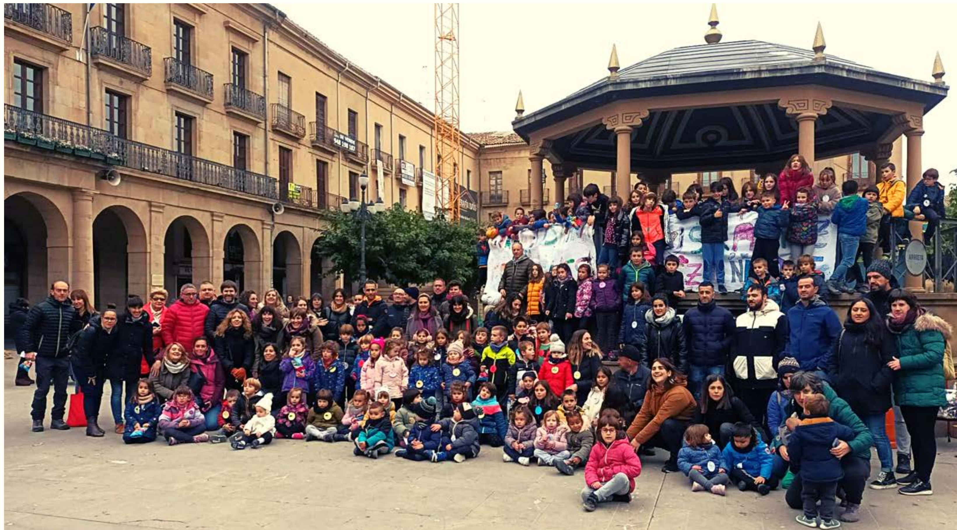
2022 Euskararen Eguna