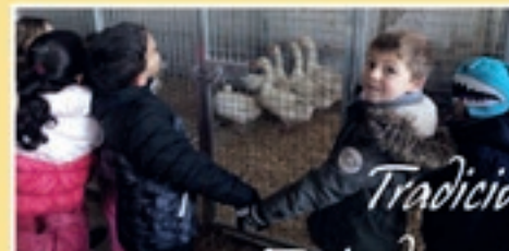
Tradiciones Feria de ganado