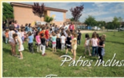
Patios inclusivos Techo-carro musical