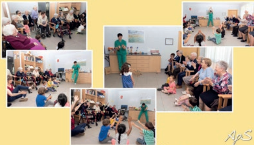
ApS Taller intergeneracional