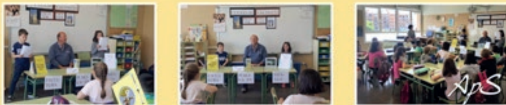
ApS Triptico informativo - Escultor tafallés