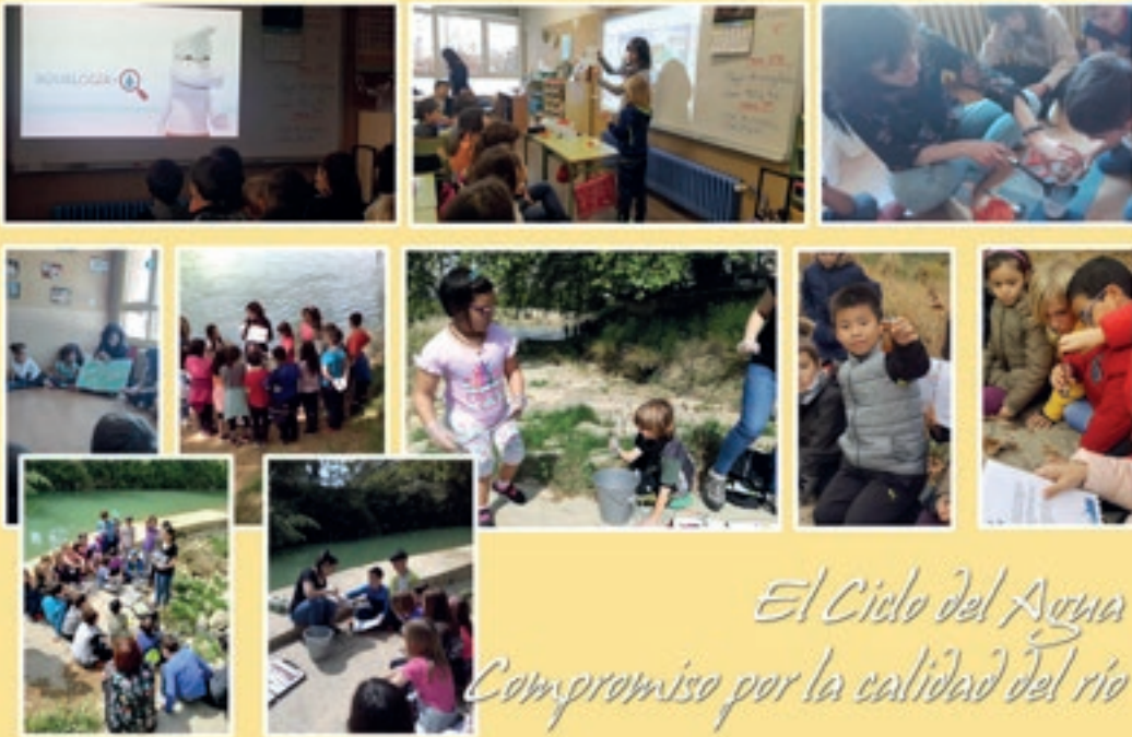
El Ciclo del Agua Compromiso por la calidad del río