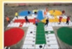
Patios inclusivos Juegos pintados en el suelo