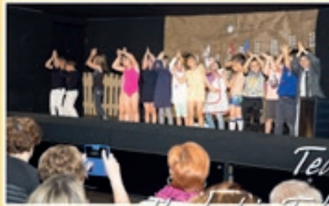
Teatro I'm lost in Tafalla