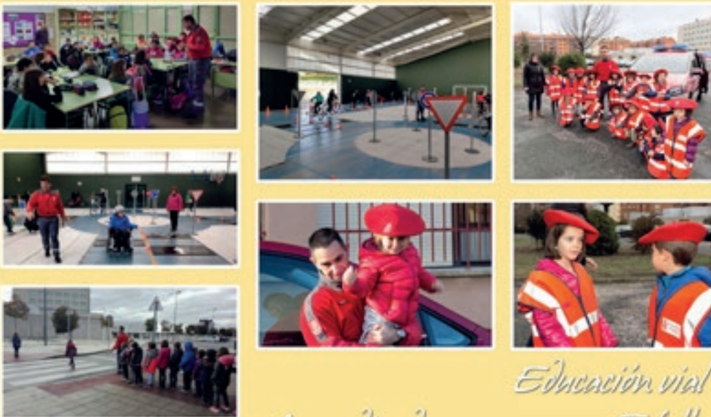
Educación vial Aprendiendo a moverse por Tafalla